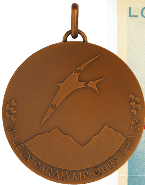
Jean-Michel Folon, Médaille de bronze des 5 e Jeux d'hiver paralympiques (Tignes-Albertville, 1992) © Fondation Folon / Adagp, Paris, 2024

Cette exposition plongera les visiteurs dans l'univers de la médaille olympique, soulignant le rôle emblématique de la Monnaie de Paris dans la création et la fabrication de ces objets prestigieux depuis les premières éditions des jeux olympiques de l'ère moderne.