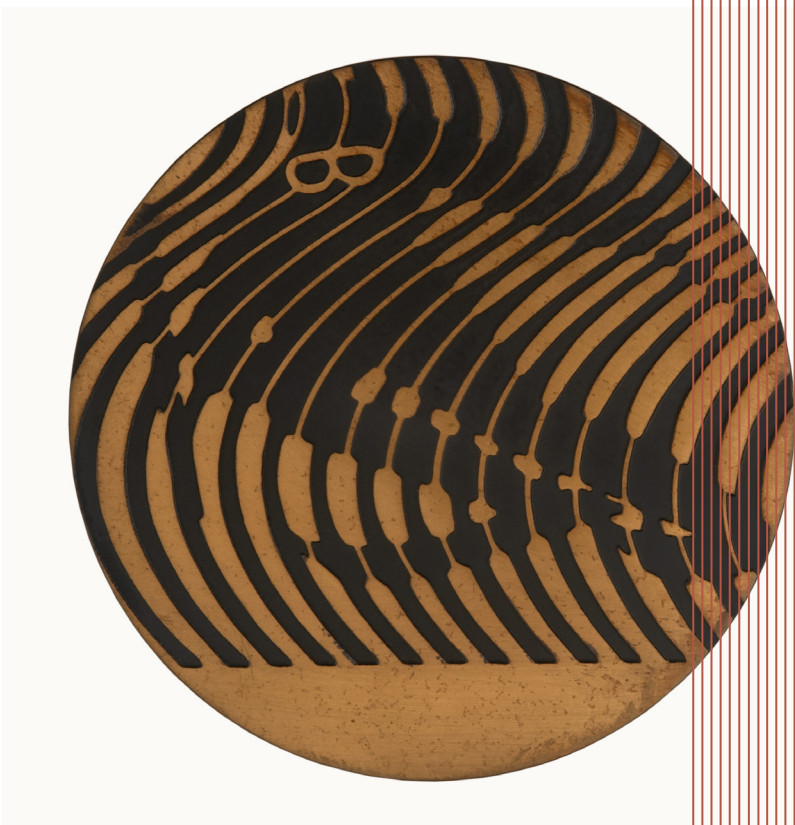
Médaille de bronze (slalom) des X e Jeux Olympiques d'hiver Grenoble 1968 - avers Roger Excoffon – Bronze / Collections historiques de la Monnaie de Paris

« 2024 est l'année des Jeux Olympiques et Paralympiques. La Monnaie de Paris a l'immense privilège de fabriquer les médailles qui seront remises aux athlètes. Qui, mieux que nous, pouvait retracer l'histoire de ces récompenses, sans doute les plus convoitées du monde sportif ? Qu'elle soit d'or, d'argent ou de bronze, la médaille olympique constitue un symbole unique du dépassement de soi. Cette exposition est l'occasion unique de se plonger dans l'univers de cet objet devenu synonyme de consécration. »