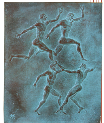
Plaquettes commémoratives des Jeux de la XI e Olympiade (Berlin, 1936) d'après l'antique. Fonte de bronze patinée, Fonderie Lauchhammer NN, Collections historiques de la Monnaie de Paris

Cette exposition, qui a obtenu le label « Olympiade culturelle », est réalisée en collaboration avec le Musée Olympique et le Musée National du Sport.