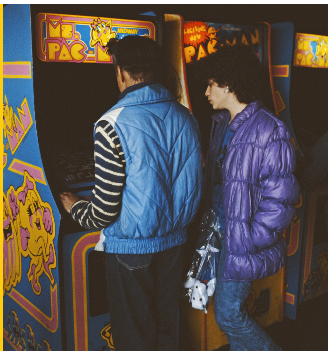
A couple playing arcade games, namely Ms. Pac-Man, New York City, circa 1985

À travers le regard et l'expertise de ses deux commissaires, l'exposition « Insert Coin » promet une rétrospective inédite et une expérience interactive qui ravira les passionnés de jeux vidéo, d'histoire et de pop-culture.